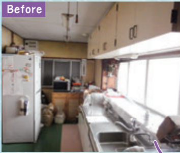
Before サララップやその他調理小物は、手を伸ばせばすぐに届く高さにある「アイラック」収納が便利です。

30年以上使い続けたキッチン、そろそろ新しく綺麗なキッチンに取り替えたいわ。システムキッチンは、娘さんと一緒に見て選ばれました。