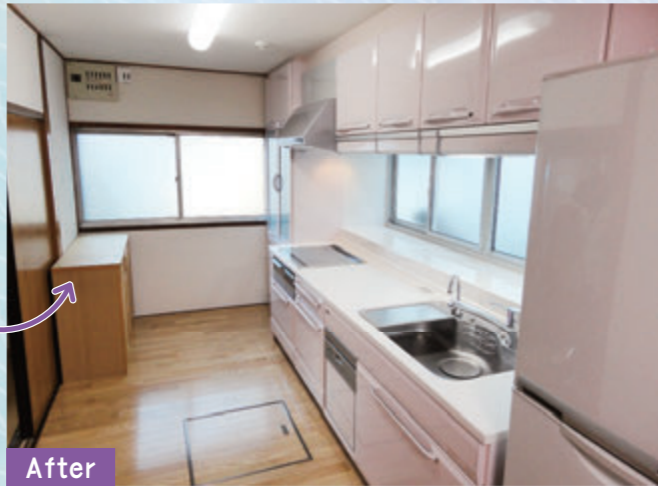
After 食器洗い乾燥機を新しくつけられ、便利にご利用中。淡いピンク色の扉カラーがお気に入り♪ カップボードも同じシリーズで揃えて、見た目もスッキリ！キッチン・ダイニングの照明機器はエコで省エネなLEDに取り替えました。