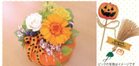
【プリザーブドフラワーとは】生花を本物に近いような柔らかさ・色合いを長く保てるよう特殊加工された枯れない生のお花です。生花と変わらないみずみずしさやソフトな感触・色合いなどが魅力で環境がよければ1年以上楽しめます。