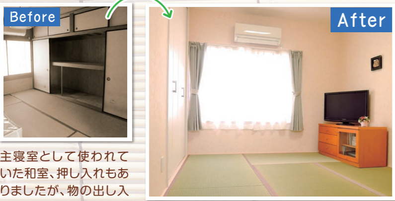
主寝室として使われて いた和室、押し入れもあり ましたが、物の出し入れが しづらいとお悩みでした。

やはり和室が良いとの事で畳を残すことに…。 壁・天井をクロス仕上げにし、使い勝手の良い、 大きなクローゼットを作りました。パツと明るく 落ち着く部屋になったと喜ばれています。