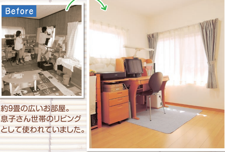
約9畳の広いお部屋。 息子さん世帯のリビング として使われていました。

2人のお子さまの成長に合わせ、個室が2つほしいとご相談いただき、リビングを間仕切る事になりました。 娘さんの部屋は、今トレンドのホワイトで統一し明るくかわいい空間になりました。