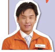
LIXILリフォームショップ 服部

派 手な音楽とともに劇的ビフォーアフターが映し出される某テレビCMに刺激されて、昨年からダイエットをしています。といってお金はかけない方法、自宅でできる腕立て伏せと腹筋、スクワットなどの筋トレと、あとは低糖質の食事です。期間はかかりましたが、この8月で76kgから64kgまで、12kgダウンさせることができました。最近ではココナッツオイルを食事に使ったり、コーヒーに入れて飲んだりしていますが、空腹感も抑えられてすごく調子いいですよ! (大道)