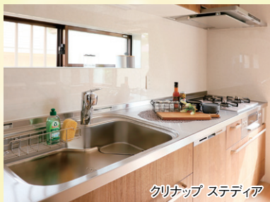
クリナップ ステディア

水や熱に強く、お手入れがしやすいステンレス製のキャビネットキッチン。いままではコンセントが冷蔵庫の裏にあり、使いにくさを感じておられたので、調理中にも使いやすいよう、シンクとコンロの間にもコンセントを設置しました。