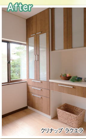
クリナップ ラクエラ

キッチンの向かい側には、キッチン用品や食器をたっぷり収納できる、大容量のキャップボード。隣のカウンタータイプのキャップボードは家電や小物類を置くのに便利です。キッチンとキャップボードは、似たデザインを選ぶことで統一感を出しました。