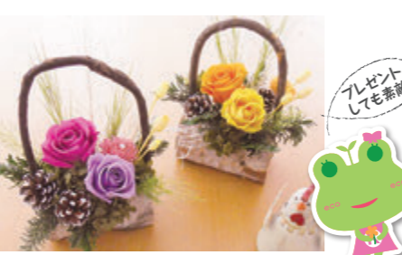
花器サイズ: W10.5×H18cm ※カラーはピンク系かオレンジ系の2種類より選べます。