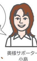
奥様サポート 小島

6月号のアンケートでお寄せいただいた省エネのコツを大公開! エネルギーの大切さと向き合う今、おうち単位でできることが、大きな節約・節電につながるのですね。一日を通してエネルギーのムダは少しでもなく、効果的かつ無理のない省エネを心がけましょう。