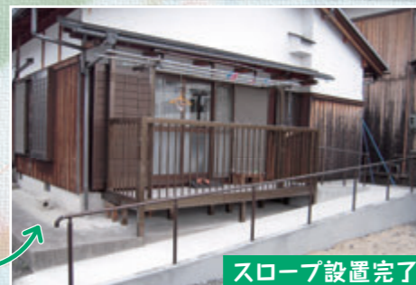
スロープ設置完了

足を痛められたおばあさまが退院されてからも屋内外に出入りができ、過ごしやすいようにと、掃き出し窓にバルコニー、スロープ設置。