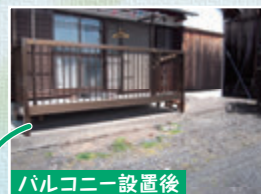
バルコニー設置後

足を痛められたおばあさまが退院されてからも屋内外に出入りができ、過ごしやすいようにと、掃き出し窓にバルコニー、スロープ設置。