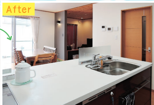
LIXIL システムキッチン アレスタ 間口2,700mm

比較的新しいF様邸ですが、キッチンとリビングの境に大きな壁があり、圧迫感を感じてしまうこととお悩みでした。