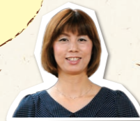
奥様サポーター 小島

とにかく簡単☆おうちにある材料で、濃厚な味噌ベースの「つけめんダレ」が作れます。