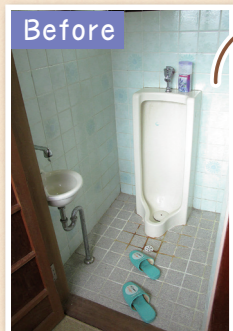
男性用・女性用と、出入口から分かれていました。タイルでお手入れが楽。