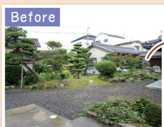
広いお庭は、雑草のお手入れが大変。