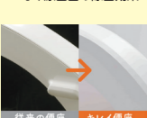
従来の便座 キレイ便座

汚れの入りやすい「つぎ目」をなくしたキレイ便座は、防汚素材でお掃除ラクラクです。