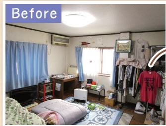
2世帯住宅にするため、もともとあった離れの洋室をLDKへリフォームしたい。