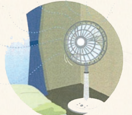
扇風機は部屋全体の空気をかき回す感覚で上を向かせましょう

眠るときに、エアコンを使うこともありますね。暑い日は、ぜひ活用したいところ。眠りに入るとき、気持ちの良い温度にすることが大切なので、最適な設定温度は26~28度がおすすです。扇風機は、体にあて続けるとだるさが残り、快適な目覚めの妨げになるため、気をつけましょう。