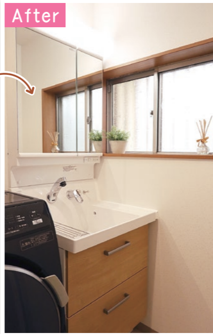
LIXIL ヒアラ 間口600mm

シンプルで清潔感のあるデザインを気に入って選ばれました。お風呂場の無駄なスペースを省いて洗面所を広く取ることができました。また、今まで遠くに置いていた洗濯機を洗面所へと持ってくることができました。洗濯も効率よくすることができます。