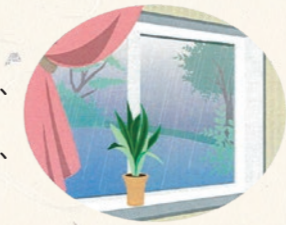
朝の体内リセットは曇りや雨の日でも外を見るだけで効果アリ!

大切なのは、体内時計を整えること。同じ時間に起きて、朝食を食べることもおすすめですが、さらに、起床後、すぐに朝日を浴びることを加えてみましょう。朝日を浴びると、「セロトニン」という人を活動的にさせるホルモンが出て、体内時計がリセットされやすくなります。時間も5分程度で充分。ぜひ、やってみてください。