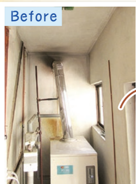
灯油ボイラー。タンクへの給油が大変になってきました。