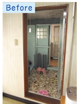
お風呂のドアが2つあり、2つ目のドアの奥に洗面所があります。

移動リフォームをして、洗面所があった場所にお風呂を配置しています。いままでのお風呂に無かったカウンターや大きな鏡、浴室暖房がつきました。大理石調のパネルを使い、明るく落ち着いた雰囲気のお風呂に仕上がっています。