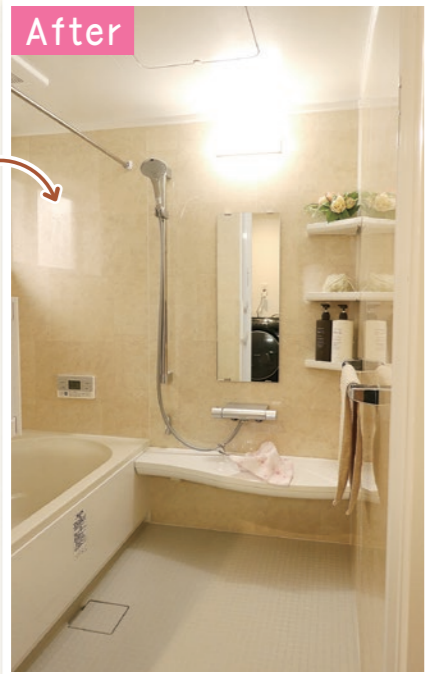
LIXIL リノビオ 1418サイズ

移動リフォームをして、洗面所があった場所にお風呂を配置しています。いままでのお風呂に無かったカウンターや大きな鏡、浴室暖房がつきました。大理石調のパネルを使い、明るく落ち着いた雰囲気のお風呂に仕上がっています。