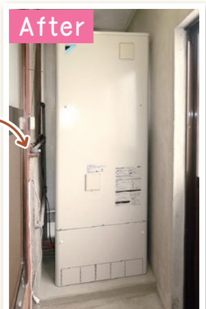
ダイキン エコキュート 370L