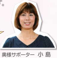
奥様サポーター 小島