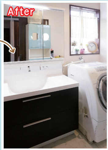
LIXIL エルシー (幅1,200mm)

長く使っているうちに、洗面ボウルとカウンターの間に大きな隙間ができ、ここから水漏れが始まりました。