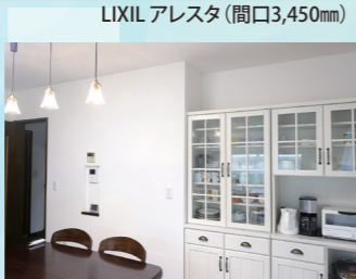
LIXIL アレスタ (間口3,450mm)

今回のリフォームでは、キッチンのデザインについて「何だか暗い見た目のキッチンなので、思い切り明るくしたい」というご要望がありました。