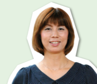
奥様サポーター 小島