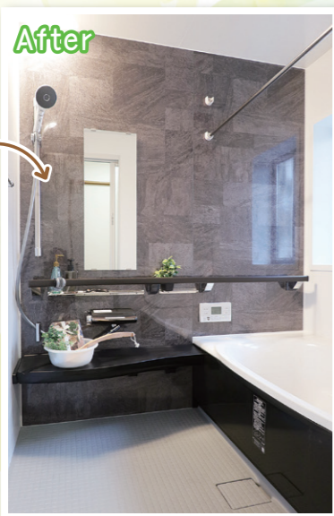
LIXIL アライズ Kタイプ 1618

また、この一本の手すり浴槽の出入りの補助に限らず、お風呂全体での動きを幅広くサポートすることが可能となり、今回のバリアフリー視点での大きな強みです。