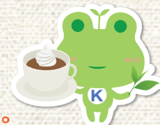
クサネン イメージキャラクター エコかえる

地味なイメージのほうじ茶ですが、今や、大手カフェチェーンなどでほうじ茶ラテが登場。タピオカドリンクにもほうじ茶ラテタイプが出るなど、このところほうじ茶がちょっとした人気に。カフェインが少ないので、小さい子どもや妊婦さんなど、幅広く楽しめますし、香ばしい香りや、テアニンという成分がリラックスをもたらすので、夜寝る前にほっこりするのにもおすすめです。