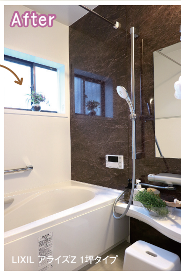
LIXIL アライズZ 1坪タイプ

入った瞬間に足元がヒヤとする、寒さがお悩み。昔ながらのステンレス浴槽は少し狭め。