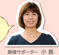
奥様サポーター 小島

まるごと1匹でもいいですが切り身を使うほうが、骨取りがカンタンです。アラを購入しても、お得に作れます!